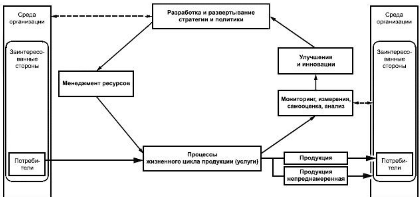
Рисунок 1 - Структура процессов системы менеджмента