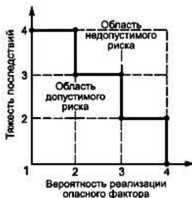
Рисунок Б.1 - Диаграмма анализа рисков